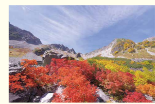
秋 | 紅葉の涸沢カールを撮る 2025年10月4日④~7日④ 参加費85,500円

穂高米河圏谷 涸沢ヒュッテ 〒390-1516 長野県松本市安曇4469-1 TEL 090-9002-2534(直通)